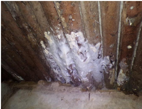
Faanyagvédelmi felmérés során regisztrált könnyező házigomba fertőzés födémszerkezeten