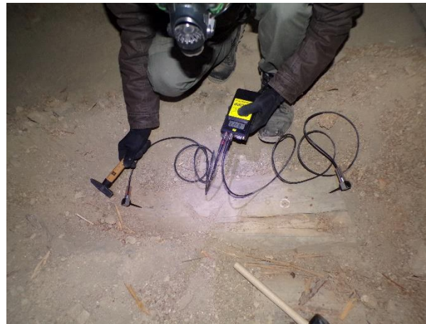
Roncsolásmentes vizsgálat födémgerendán