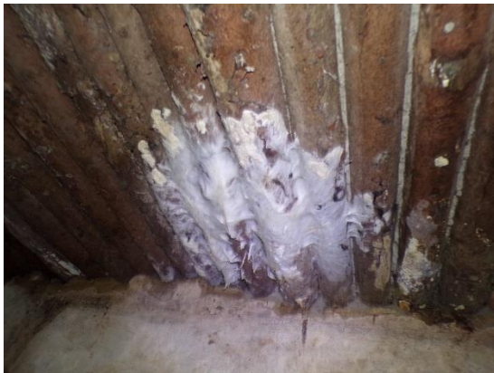
Faanyagvédelmi felmérés során regisztrált könnyező házigomba fertőzés födém szerkezeten