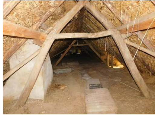
Tájház fedélszéke faanyagvédelmi felmérés során