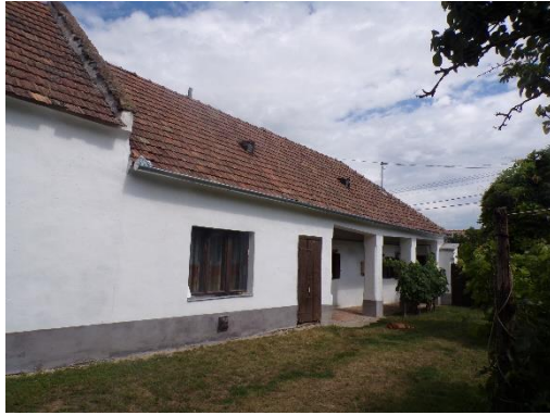
Tájház általános megjelenése