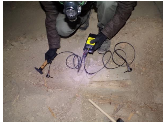
Roncsolásmentes vizsgálat födémgerendán